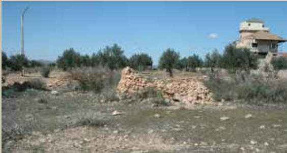
Oruç Reis'in türbesinden geriye kalanlar

kadar büyük bir arbede meydana geldi ki, çıkan bu gürültü ve patırtı ortasında istenmesine rağmen, verilen sözler yerine getirilemedi ve sonunda bu altı yüz Türk'ten kurtulan olmadı, ya öldürüldüler ya esir düştüler. Hayreddin'in kardeşi olan Manşete (İshak) ve Kaptanı Escandel (İskender) burada öldüler. Ölümeleri ve yüzlerce Türk'ün zayıyatı Kral Oruç'u çok üzdü..."