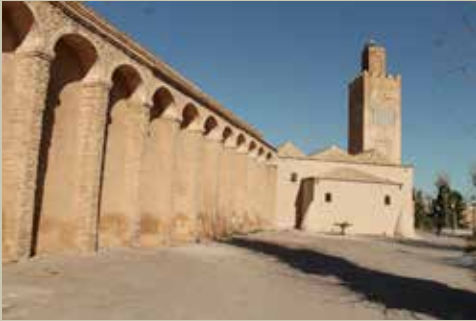
Oruç Reis'in 6 ay İspanyollara karşı direndiği Mesvar Kalesi (Tlemsen) ve köy halkı

Kraliyet Akademisi (E. 144), Diego de Haedo (Cezayir Genel Tarihi ve Topografyası 1612), Lopez de Gomara (Barbaroslar Kroniği) ve Prudencio de Sandoval (İmparator V. Carlos'un hayatı ve Olayların Tarihi, 1634) gibi İspanyol kaynaklarına göre Oruç Reis'in, Angad Ovası'nda Ucdı Nehri'ni geçip Mecenete sıradaglarına doğru giderken Ucdı Nehri kenarında şehit olduğu tablosu ortaya çıkmaktadır. Bu da demek olur ki Oruç Reis'in mezarı Cezayir'de değil Fas topraklarındadır.