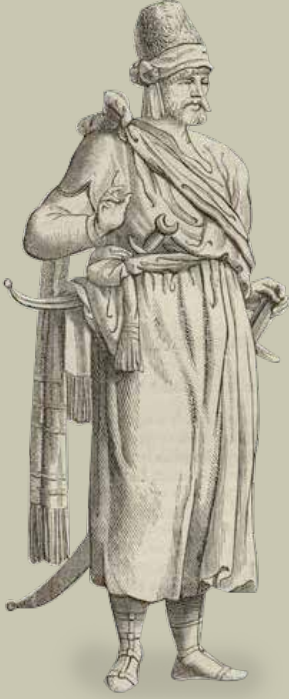
Eski bir Telemşanlıyı tasvir eden resim